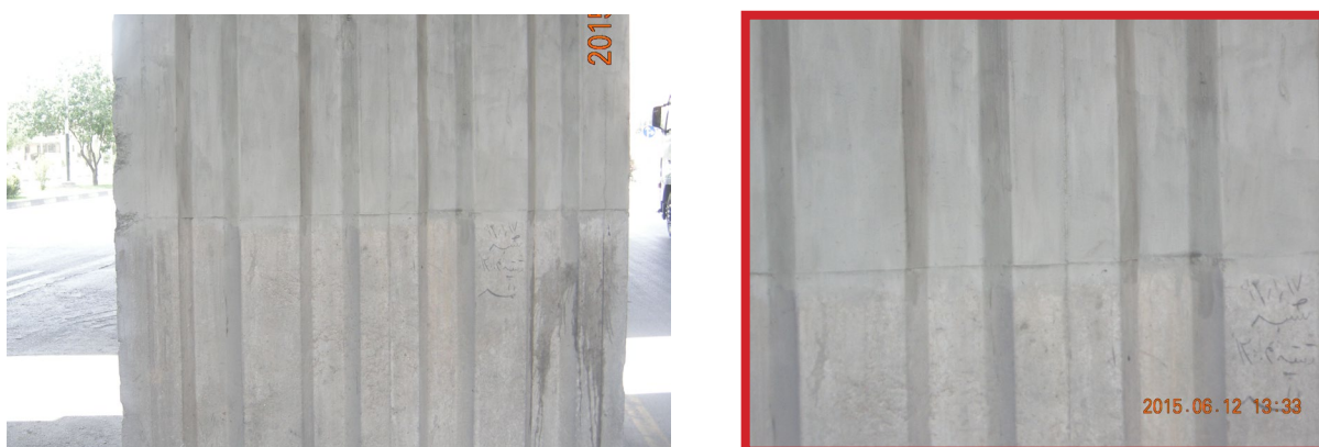
شکل ۳. اجرای پوشش مقاوم سیمانی ضدآب بر روی سطح بتنی (محدوده کادر قرمز رنگ تصویر سمت چپ) بزرگ نمای مرز بین پوشش مقاوم سیمانی ضدآب و سطح بتن طبیعی (تصویر سمت راست)

محصول نهایی به‌صورت خمیر آماده مصرف ارائه شده و در بسته‌بندی‌های سطل‌های ۱۰ کیلوگرمی با ماندگاری دوماهه عرضه می‌شود. هر واحد بسته‌بندی قابلیت پوشش‌دهی حدود ۱۰ مترمربع سطح صاف را داراست.